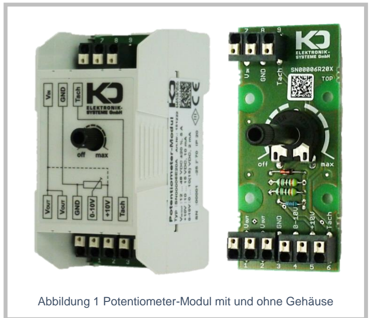
Abbildung 1 Potentiometer-Modul mit und ohne Gehäuse