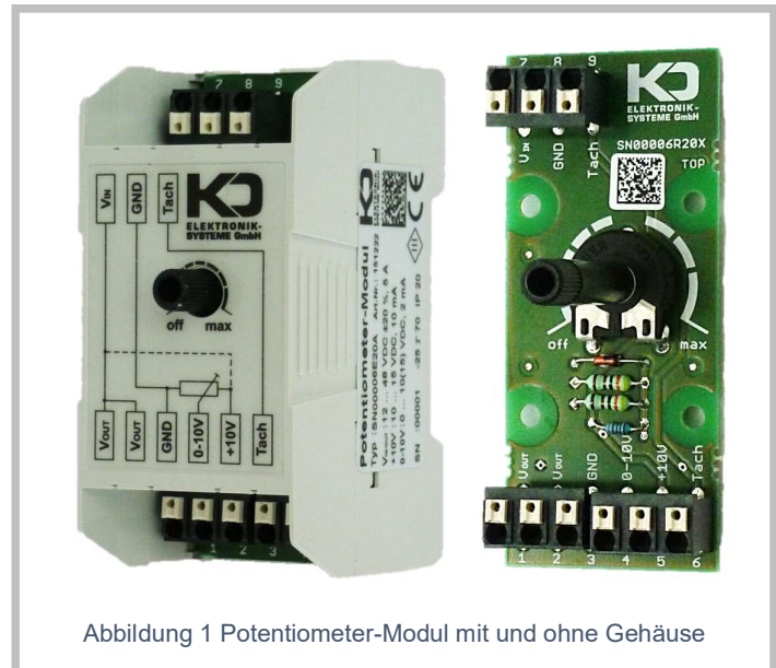
Abbildung 1 Potentiometer-Modul mit und ohne Gehäuse