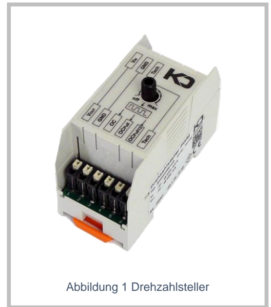
Abbildung 1 Drehzahlsteller